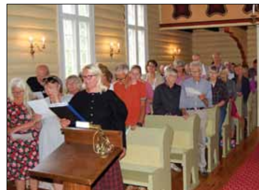
Vandringen startet i kirka.