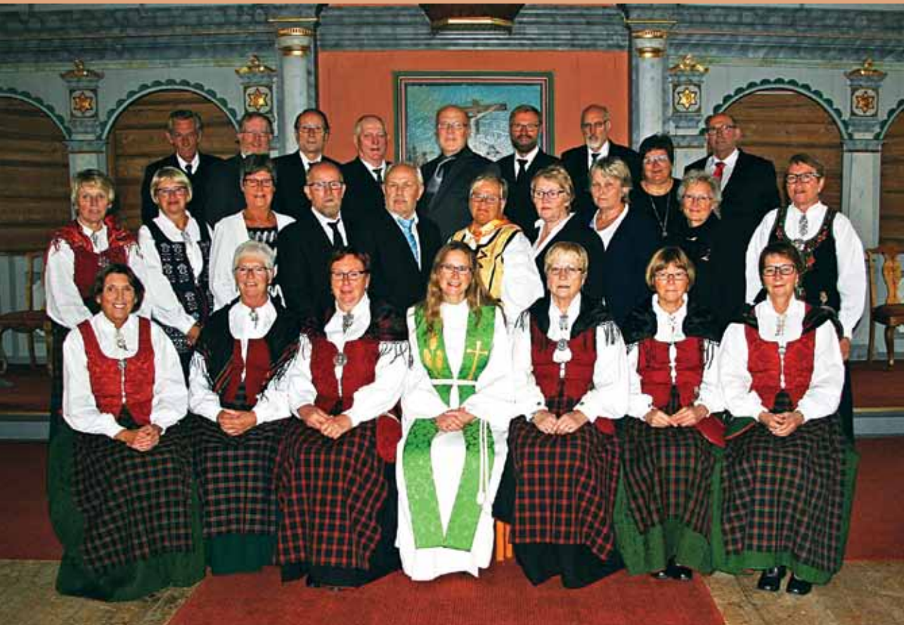
Årets 50-årskonfirmanter.

Menighetsblad for Tolga, Vingelen, Hodalen og Holøydalen sogn