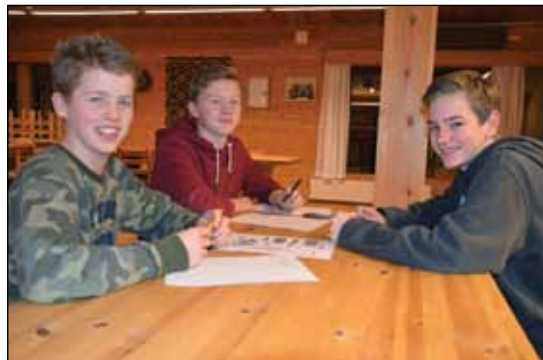
Konfirmanter i ivrig samarbeid.