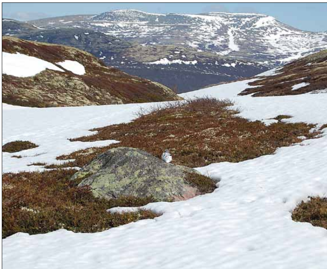
God påske!