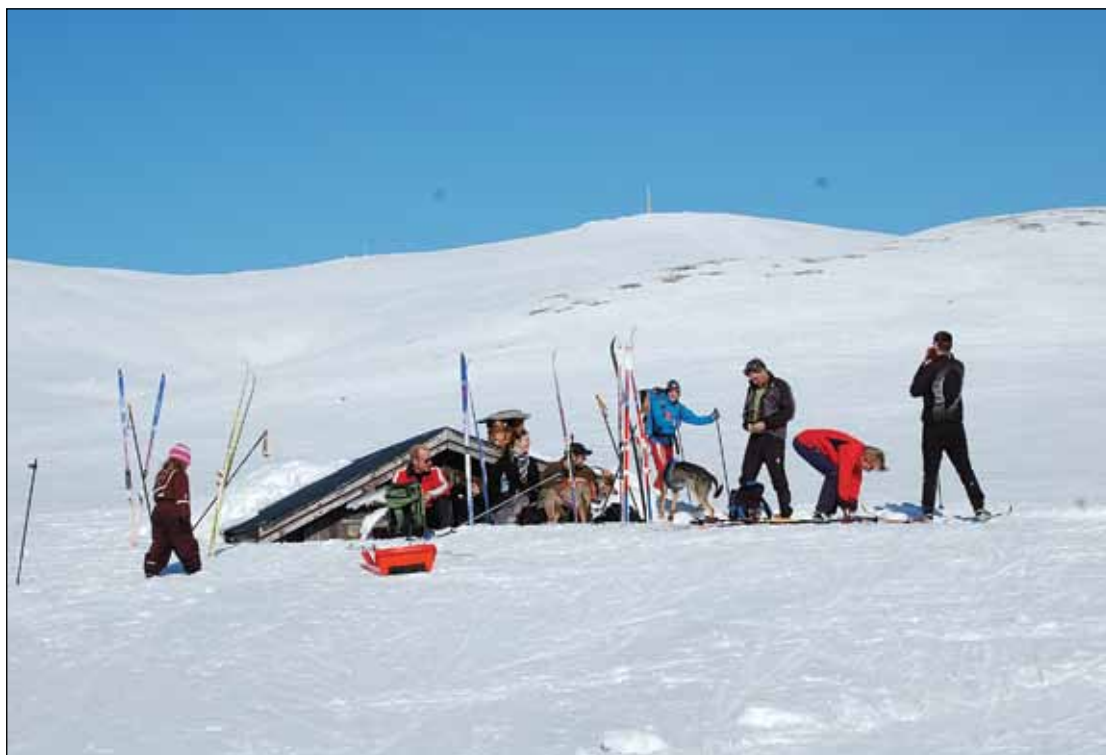
Påsketur i fjellet.